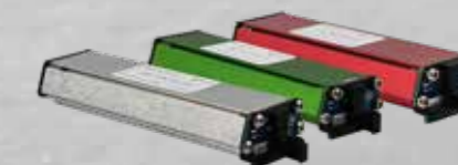
Da sinistra a destra: sensore per refrigerante 724-701-G1, sensore di CO 2 724-701-G2 e sensore per refrigerante infiammabile 724-701-G3.